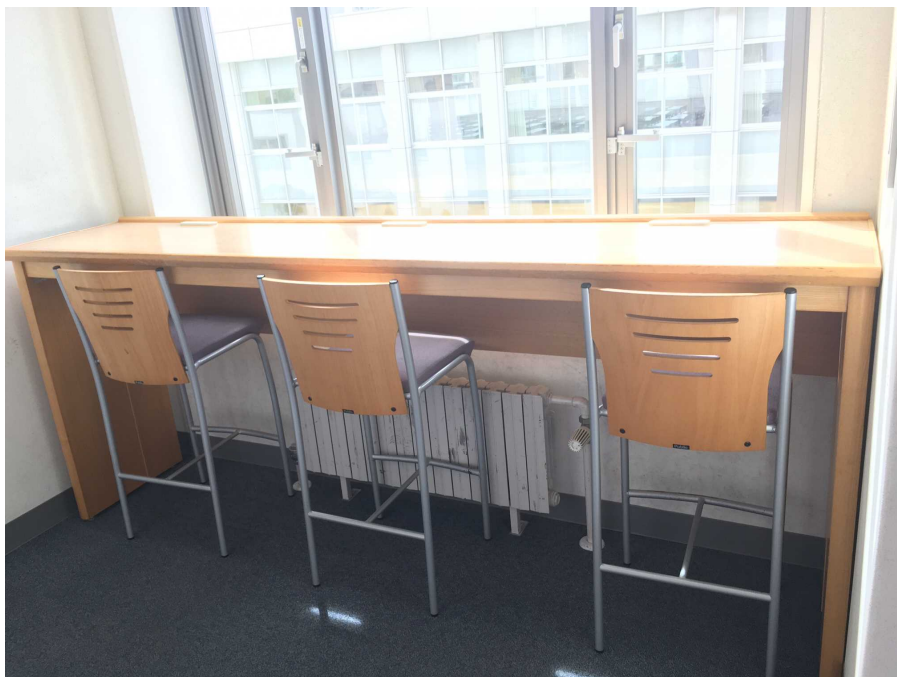
展示スペース イメージ